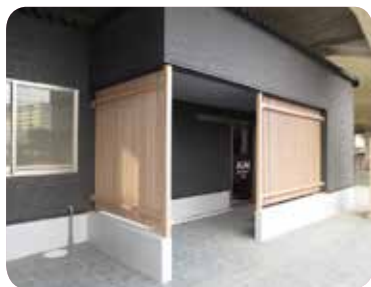
あい・あい保育園 第二新柏園

2012年から保育施設の誘致を進めており、2021年4月には新たに東武東上線新河岸駅及び東武アーバンパークライン新柏駅に、駅チカの認可保育所を開設しました。この開設により東武鉄道の駅チカ保育所は東武線全線で合計17か所になりました。