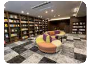
ソライエグラン流山おおたかの森 (共用部)