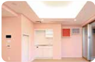
ソライエアイル練馬北町 (キッズルーム)

また、非常食の循環システム付き宅配ロッカー「イーパルボックス」を民間住宅として初めて導入しました。平常時には、日常食として自動販売し、地震発生時には、揺れを感知して自動的に備蓄BOXが開放される仕組みであり、商品は週1回補充することでローリングストック(非常食の循環)が可能となります。