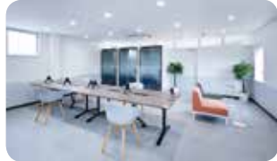
ソライエプラスワーク坂戸

これらは郊外型のサテライトオフィスであり、ご自宅近くで仕事ができる“職住近接”を叶えることで、仕事と子育て、介護、通院などの両立をサポートし、多様な働き方を支援しています。