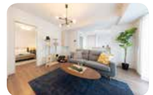
ソライエアイル岩槻

賃貸マンション「ソライエアイル岩槻」とサービス付き高齢者向け住宅はそれぞれペットとの共生をコンセプトとしており、両物件の入居者が共用で利用することのできるドッグランを設置することで、ペットとの共生を通じて多世代交流の促進を図っています。